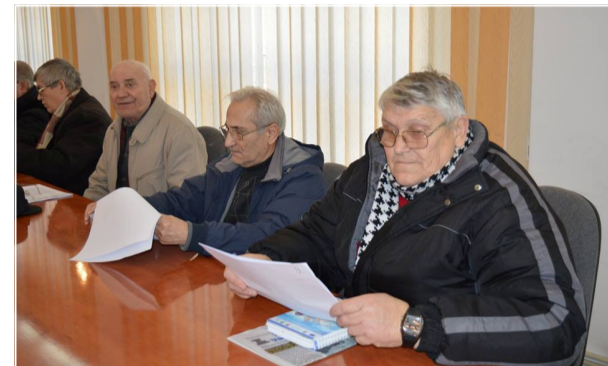
Primarul Vulcanului a precizat că la această oră este dificil să se discute alocarea de fonduri.